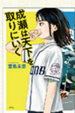
『成瀬は天下を取りに行く』 著：宮島未奈 1,705円 新潮社

成瀬あかりの物語は、彼女が友人に告げた宣言からはじまります。 中学二年生の成瀬あかりは、そのひと夏を西武に捧げると宣言します。西武とは野球の西武ライオンズではなく、西武デパート。二〇二〇年八月にコロナ禍のなかで四十四年の営業を終えて閉店した、滋賀県の西武大津店です。地元のデパートがなくなることの寂しさは、新潟市に住む人は共感するものがあるかと思えます。 さて、閉店するデパートの近くに住んでいるだけの普通の中学二年生、成瀬あかりは、どうやってひと夏を捧げたのか？ 物語の行方を楽しんでもらいたいのはもちろんですけど、なによりも本作の読みどころは主人公成瀬あかりの存在です。抜群に个性的でありながら、こんな生き方をしたいと思わせる人物像にきつと心が躍るはずですよ。