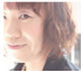
styling at HIKARIYA BARBERS