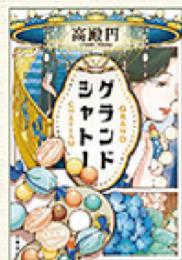
『グランドシャトー』 著：高殿 円 文春文庫 880円

キャバレーというこれから失われる文化を通して語られるのは、いつの時代も変わらない、人と人の繋がりである。誰と一緒にその時間を過ごしたか、その時間がどれほど大事だったか。寄る辺ない人たちに居場所を与えたキャバレーという原風景。遠くなっていく昭和に思いを馳せながら、本書のページを開いてみてはいかがでしょう。