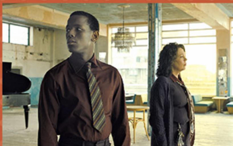
© 2022 20th Century Studios. All Rights Reserved.

アカデミー賞受賞作『アメリカン・ビューティ』や『007/スカイフォール』『007/スペクター』などを手がけたサム・メンデス監督。そんなアカデミー賞に輝く最高のスタッフと豪華なキャストが集まった作品がこの「エンパイア・オブ・ライト」です。1980年代初頭のイギリスの静かな海辺の町、マーゲイト。辛い過去を経験し、地元で愛される映画館、エンパイア劇場で働いているヒラリーの前に、夢を諦め映画館で働くことを決意した青年スティーヴンが現れます。前向きに生きるスティーヴンとの出会いに、ヒラリーは生きる希望を見出していくのですが……。困難な時代にこそ、仲間が、音楽が、そして映画館がいつもそばにあるのです。すべての人の人生に温かな光をさす、奇跡と感動のストーリー。映画館が大好きなあなたにこそ、今、ユナイテッド・シネマ新潟で観て欲しい作品です。