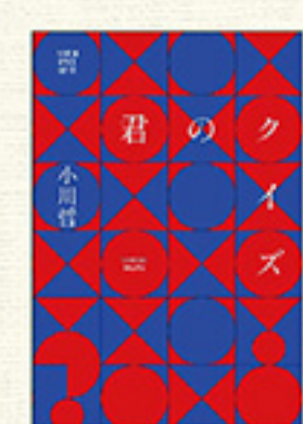
『君のクイズ』 著:小川 哲 朝日新聞出版 1,540円

てください。その世界に足を踏み込んだ人にしか見えない世界が広がっているはず。さて、私事で恐縮ですが、書店員を十年以上経たことで見えてくる世界もあります。入荷したばかりの新刊本を初めて手に取ったときに、その本がどういった評価を得るのか、そのおおよその見当が付くようになりました。たとえば推理小説は、年末に発表されるランキングに入選される本かどうかはだいたい分かります。一ページも読まなくともそれは分かる。「人気作家の新刊だから」と言う根拠でもありません。新人作家の著作でも高い評価を得るだろうなど分かるときもあれば、人気作家の著作でもあまり評価されないだろうと分かるときもあります。 このように、ひとつの仕事等を通じて見ると、何かしら見える力が得られることがあります。ちなみにベストセラーになる本