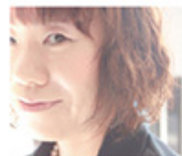
styling at HIKARIYA BARBERS