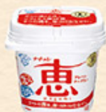
ナチュレ 恵 megumi