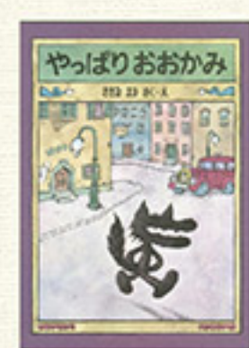
『やっぱりおおかみ』 著：佐々木マキ 福音館書店 990円

ナンセンスかつ前衛的作風で『ガロ』を代表する作家のひとりとなる。 そのあまりに実験的で難解なマンガのスタイルに対して、読者から「佐々木マキのページ数だけ金返せ」との心ない声もあつたらしい。 また、「マンガの神様」手塚治虫にも「わからぬマンガをもてはやす風潮」との批判もされている。(もっとも手塚治虫に批判されるのが名誉であることは、マンガ業界では有名である) その一方で、佐々木マキから大きな影響を与えられたのが村上春樹である。村上は「あの頃、佐々木マキが我々の世代に与えたのと同質のショックを、僕は僕の小説によって若い世代に与えたいと思う」と語り、デビュー作『風の歌を聴け』の表紙を佐々木マキに頼んでいる。そして今も店頭に並ぶ村上春樹の初期作品は、佐々木マキのイ