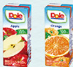
Dole® 各種 アップル・オレンジ グレープフルーツミックス グレープ