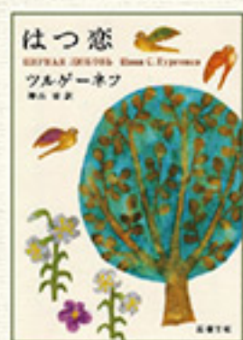
『はつ恋』(新潮文庫) 著：ツイゲーネフ 440円

一八六〇年に発表されて以来、恋愛小説の古典作品のひとつとして今なお多くの読者を獲得し続けている『はつ恋』。多感な十代を経て歳を重ねた読者であれば、きっと作中の終盤で唱える、『青春』への言及に胸を打たれることだろう。ふと振り返って思いをはせることがある、『青春』。その傲慢で憂鬱な存在の正体を考える材料のひとつになるかもしれない。さて、三日前の昼飯を思い出せない自分であるが(一週間前を思い出すのは諦めた)、思い悩むことがなくなったかという、まったくその気配がない。失敗事をした日には、夜に布団をかぶって叫びたくなるくらい感情に苛まれる。仮に『青春』が多感で心を乱しやすい時期を指すのであれば、いまも現役で『青春』まっさかりだ。もっとも学生時代と違うのは、「どうせこの感情はそのうち忘れてしまっし、とくに最近のことは忘れやすいから」と、そんな遅効な処方箋を自分に出せるくらいである。