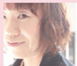
styling at HIKARIYA BARBERS