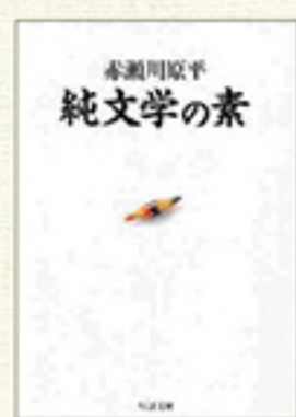
『純文学の素』 著：赤瀬川原平 ちくま文庫 1,045円

した作家がいました。赤瀬川原平さんです。ルポタージュとは、現場に赴き、取材から得た知見を文章に落とし込む作品であり、外出して大勢の人と会って特ダネを見つけることを前提としています。まさに三密なくしては為し得ない仕事です。しかし、原平さんはほとんど外出することなく、日常生活の中から、驚嘆と爆笑を誘うほんの微細な物事を発見し、考察を行っていきます。そして、そのほとんどが在宅で完結していること、の偉大さ。時計、タリ、刃物、雨桶など日用品のなんともない素材のどこに、こんなユニークで奥深い世界が隠されているのか、私たちに到底、気が付くことができません。作家の持つべき才能なのか、はたまた原平さんだけが持つ特異な能力なのか(後者が正しいと思います)もはや、想像と妄想と空想、夢想、思想、頭の中だけで、酸いも甘い