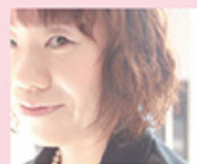
styling at HIKARIYA BARBERS