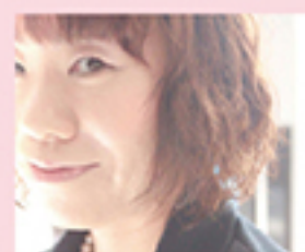
styling at HIKARIYA BARBERS

週に1・2本はユナイテッド・シネマ新潟で映画を鑑賞している自称・新潟のLiLiCo(笑)現在、ラジオ番組への出演やイベントMC、婚礼司会の他、プロバスケットボール、Bリーグ1部に所属する、新潟アルビレックスBBのホームゲーム会場で会場アナウンスも務めている。