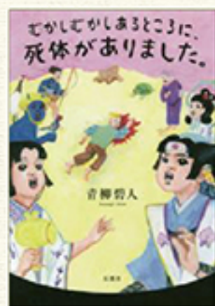
青柳碧人/著 双葉社 1,430円

がとても斬新で驚きました。誰もが知っている昔ばなしがミステリになっているのです。 小さな身体で勇敢に鬼と戦い姫を守った一寸法師は、打ち出の小槌で大きくなり姫と結婚。幸せに終わる物語のはずが、まさか殺人事件の容疑者に!?(一寸法師の不在証明) 花咲かじいさんのお話のその後、誰からも好かれていた優しいおじいさんが、何者かに殺害された。飼った犬の視点で書かれた、意外すぎる結末とは。(花咲か死者伝言) 亀を助けて竜宮城へ招待された浦島太郎は、夢のようなもてなしを受ける。しかし、そこで密室殺人が起きて事態は一変。海の生物たちよりも人間の方が知恵はあるだろうと、事件